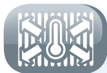
Distribuzione omogenea del calore