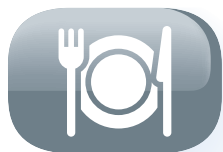
Numero di persone (5-6)