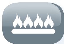
Fuochi in acciaio inossidabile